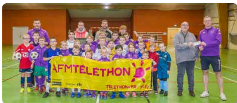
Le RC Samer