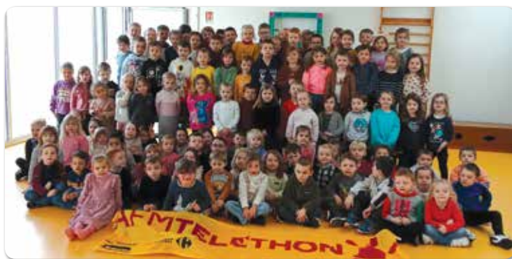
L'école Jean Moulin