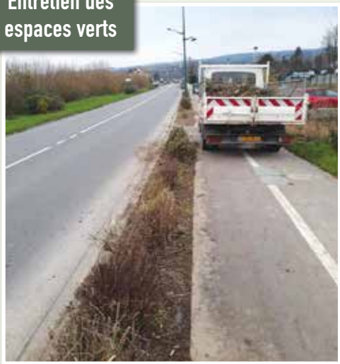
Entretien des espaces verts