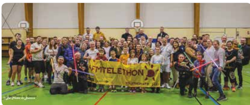
Le badminton et l'atelier aux 1000 armes