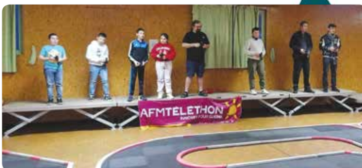
Team Models Car

Source : Fabrice Duhamel Sources photos : Les Photos du Beausse Jean-Michel Martel Les associations