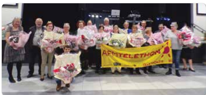
Le Club du 3 ème Age