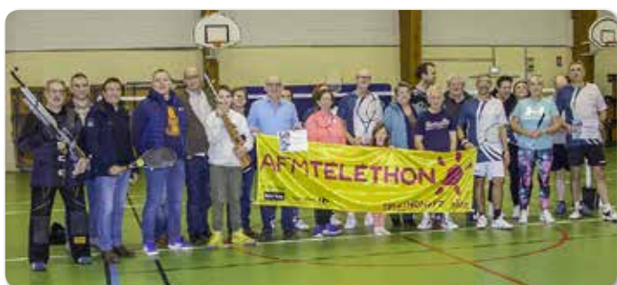
Le badminton, le tennis, l'Atelier aux 1000 armes, le tir et le tennis de table