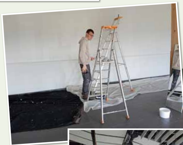
Remise en peinture de la salle polyvalente