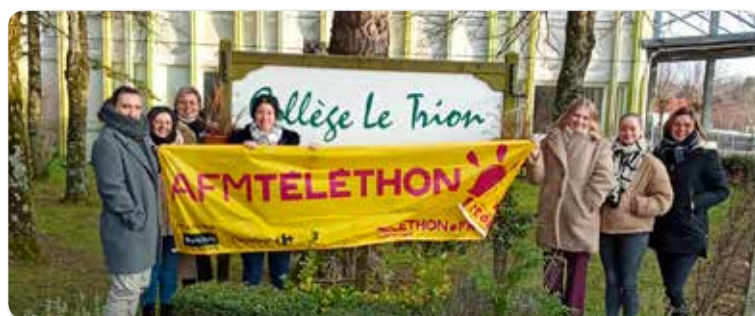
Le collège du Trion