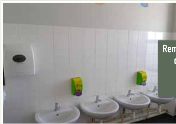
Remise en peinture de la cantine de la salle polyvalente