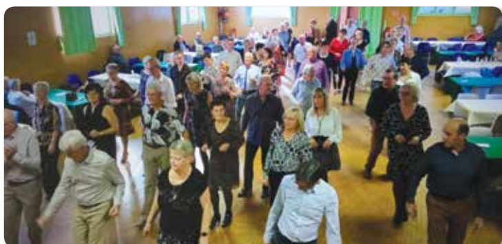
Samer Danse de Salon