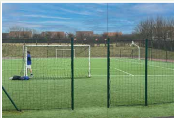
City-Stade Lemanski - Changement des filets, nettoyage et création de cinq nouveaux accès