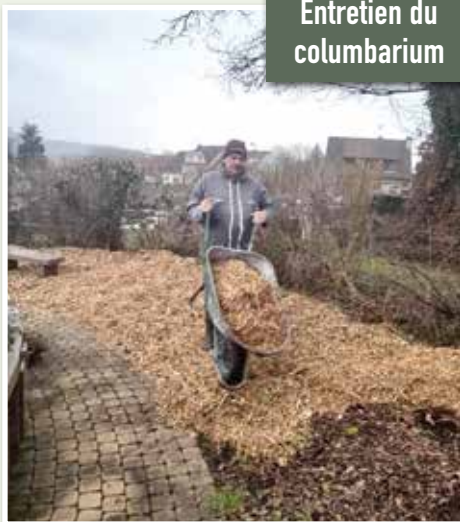
Entretien du columbarium