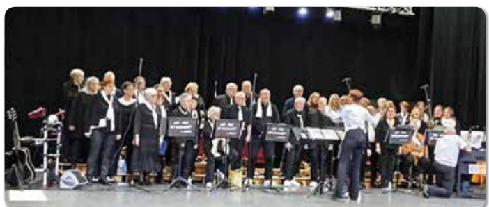
Concert les Voix du Caraquet