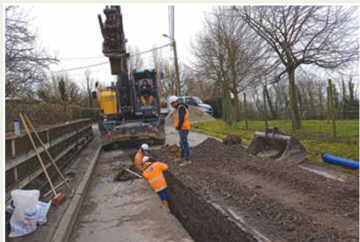
Renforcement des canalisations, Chemin du Tournier, pour éviter la turbidité de l'eau lors de prochains orages. Travaux réalisés par le Syndicat des Eaux de Samer et Environs