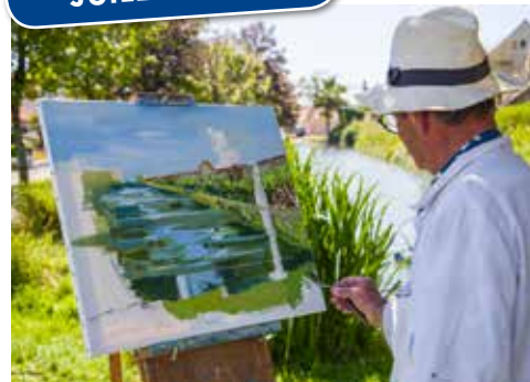
Peintres dans la rue