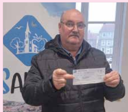
Don de 150€ de l'association des Amis du Cheval Boulonnais