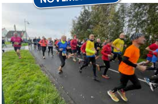
Cross de la Biche