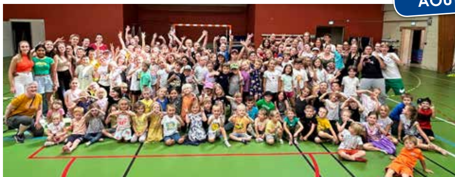
Centres de Loisirs