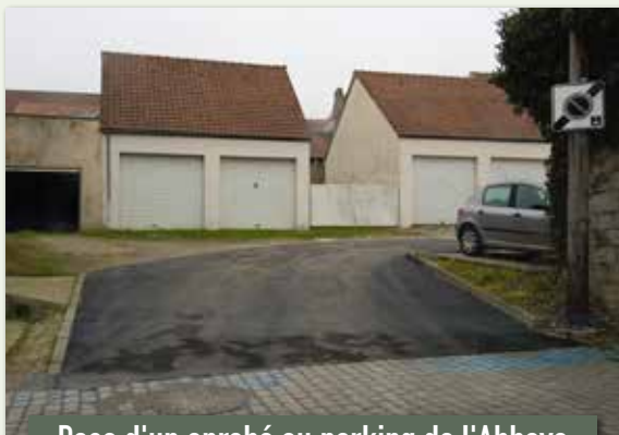
Pose d'un enrobé au parking de l'Abbaye