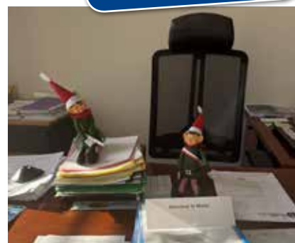
Les lutins débarquent à Samer