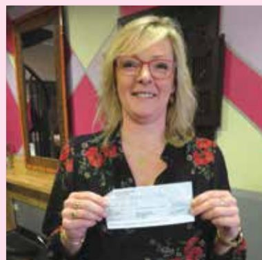
Don de 200€ des Boucles de Cléo