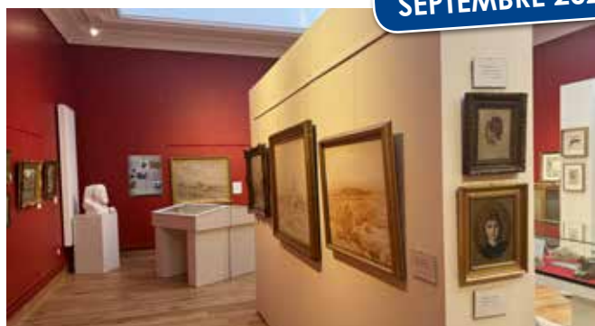
Inauguration du musée Cazin