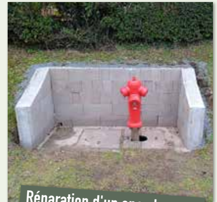
Réparation d'un encadrement d'une pompe à incendie, rue de Neufchâtel, par nos employés