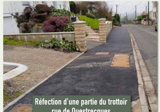
Réfection d'une partie du trottoir rue de Questrecques