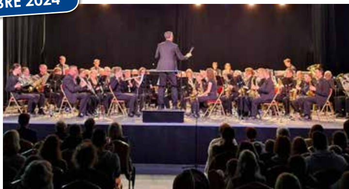
Concert de l'Harmonie