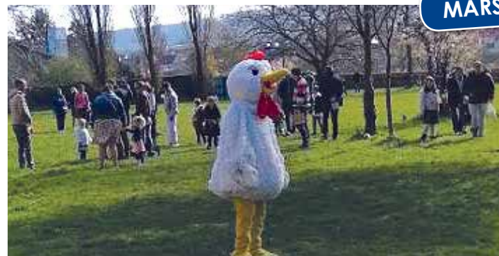
Chasse aux œufs