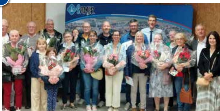
Concours des façades fleuries