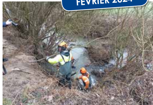
Curage des cours d'eau