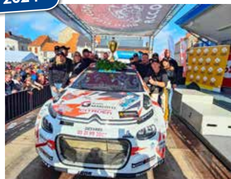
Rallye du boulonnais