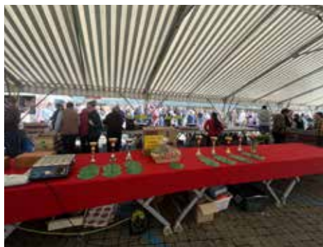
Fête des fraises