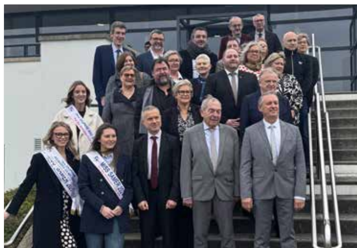
Source texte : Christophe Douchain, Carole Meklemberg, Sébastien Pont

Hôtel de Ville : 84 Grand'Place Foch, 62830 Samer ☎ 03 21 33 50 64 - Fax : 03 21 83 57 97 - email : mairie@ville-samer.fr