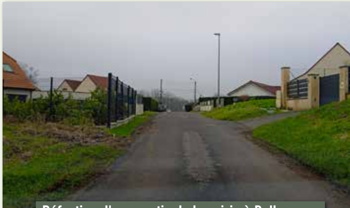
Réfection d'une partie de la voirie à Bellozanne