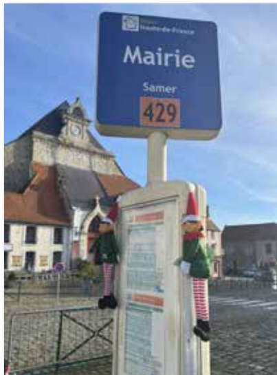
L'arrivée des lutins

Tout au long du mois de décembre, les lutins baptisés Vice et Versa ont laissé leur marque en mairie et les lieux publics. Chaque jour était une nouvelle surprise pour les Samériens !