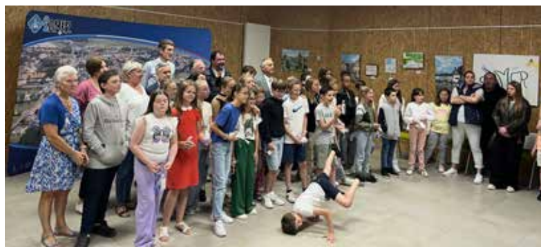
Remise des cadeaux aux enfants entrant en 6 e