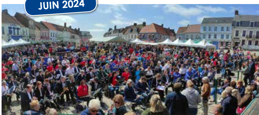
150 ans de l'Harmonie Municipale