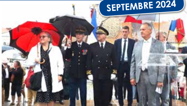
80 ans de la Libération de Samer