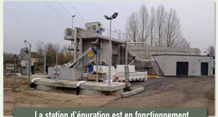
La station d'épuration est en fonctionnement depuis la fin d'année 2024