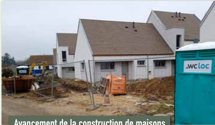
Avancement de la construction de maisons pour location à la Résidence du Parc