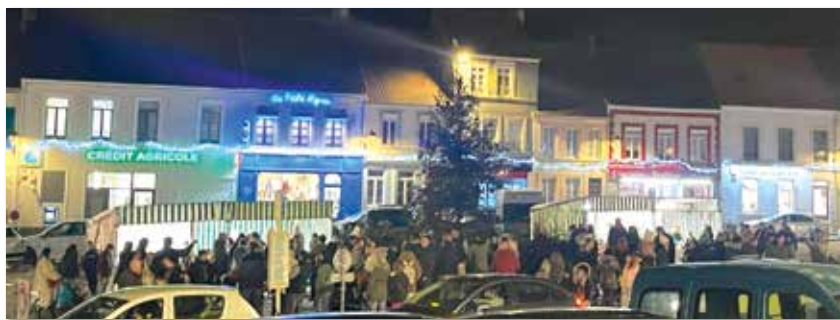
Source texte : Carole Meklemberg

Un grand merci au comité des fêtes pour cette magnifique organisation qui a permis à tous de vivre un Noël avant l'heure et à nos services techniques pour l'installation des illuminations.