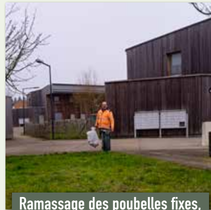
Ramassage des poubelles fixes, chaque semaine, dans les quartiers de la ville