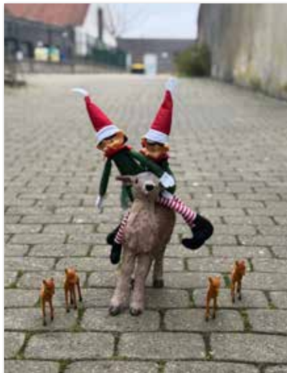
Le cross de la biche