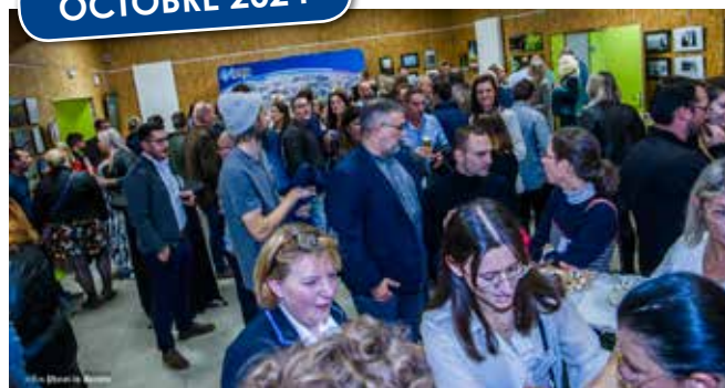
Soirée des Professionnels