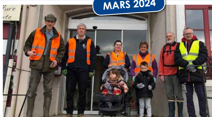
Opération Hauts-de-France propres