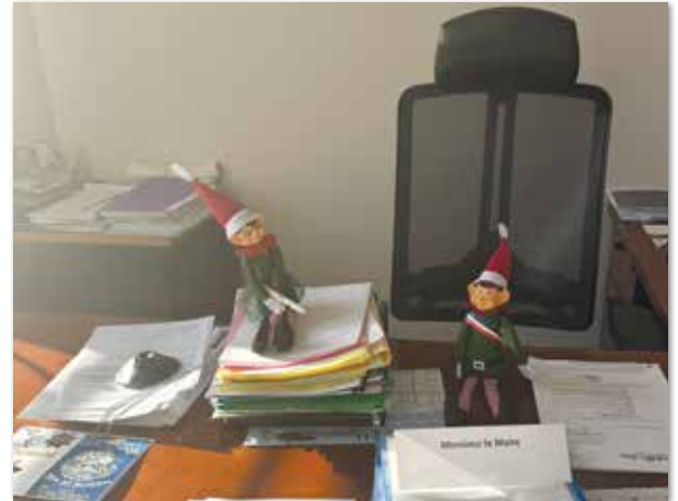
Les lutins ont élu un nouveau maire

Ils ont également inspiré les plus jeunes, qui ont donné libre cours à leur imagination en les dessinant pour le concours de dessins de Noël. Des œuvres pleines de couleurs et de créativité qui ont enchanté le jury et témoignent de l'impact de ces petits êtres malicieux sur la communauté.