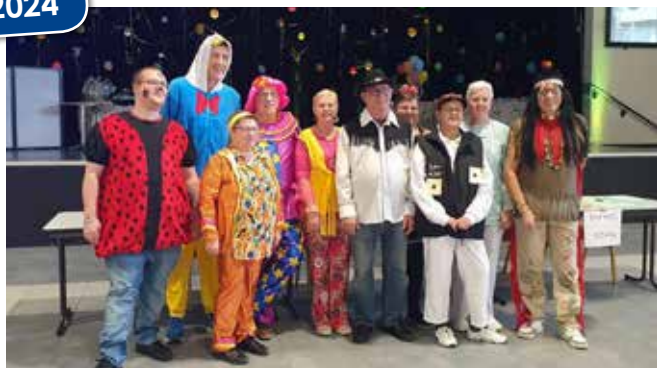
Carnaval du Comité des Fêtes