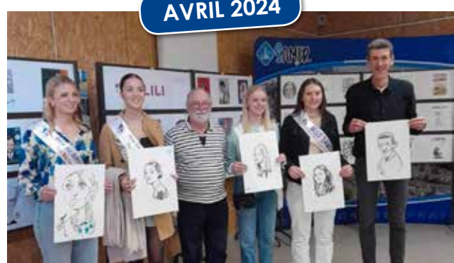
Salon de la Caricature