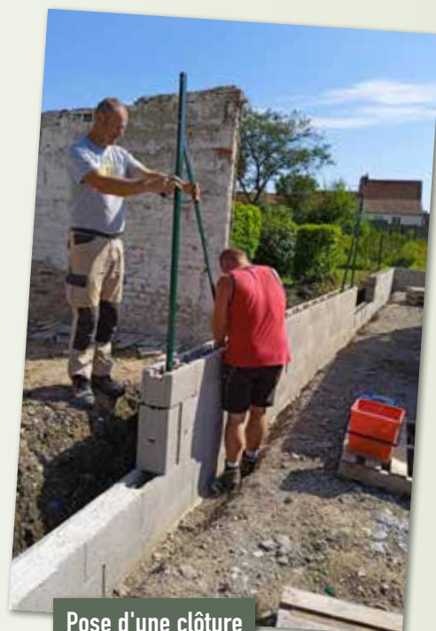
Pose d'une clôture à l'école Coustès