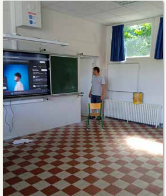
Remise en état des salles de classe dans les écoles