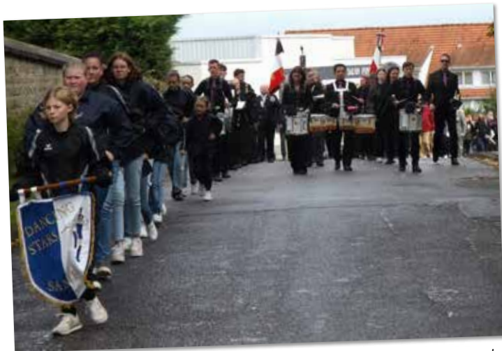
Entre deux averses, le défilé est parti jusqu'au monument aux morts où la commémoration a débuté, suivie par le dépôt des gerbes et une plaque commémorative