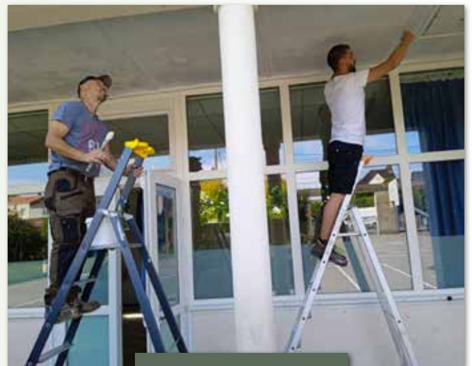
Travaux dans les écoles