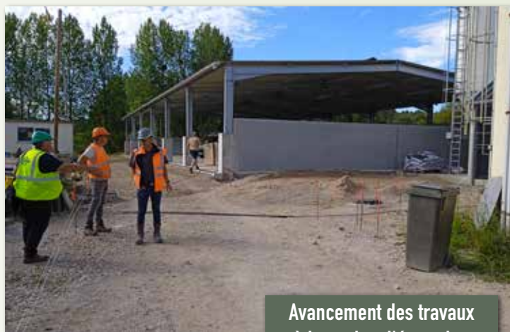
Avancement des travaux à la station d'épuration