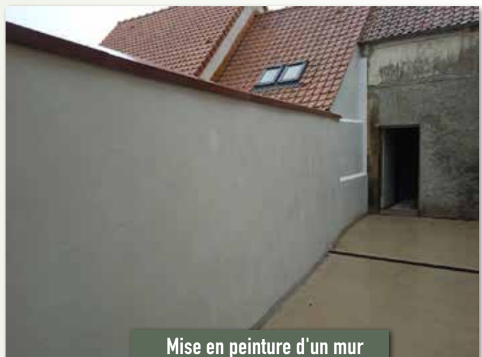
Mise en peinture d'un mur derrière la salle Henri Mory