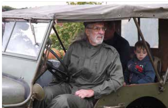
Baptême en jeep