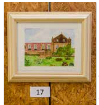
1 ère ado : Célia