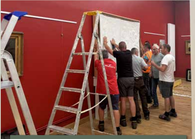
Pose d'un bas relief en plâtre de Marie Cazin au musée