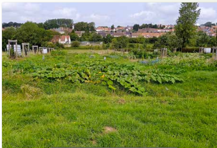
Premières récoltes dans les jardins familiaux