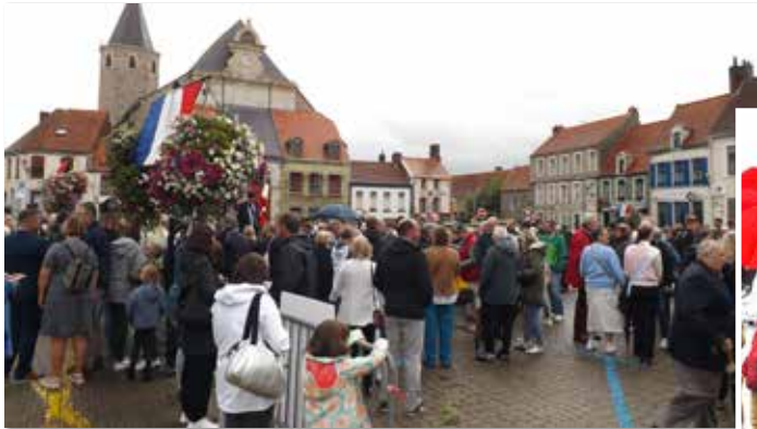
Beaucoup de monde sur la Grand' Place pour le début des commémorations, malgré la pluie.

Par ce temps pluvieux, pour la commémoration des 80 ans de la libération de SAMER, de nombreuses personnalités ainsi que des Samériens étaient présents pour cet événement.