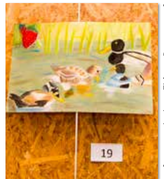
3 ème adulte : Céline Beuque

Source texte : Valérie Delattre