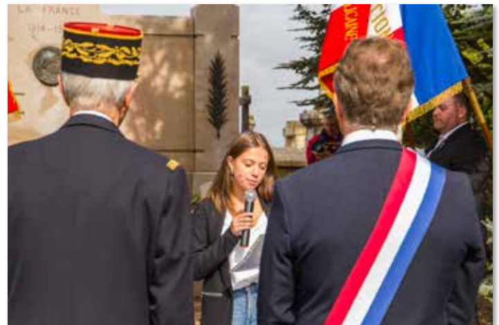
Lecture d'une lettre d'un jeune soldat à sa famille par une jeune Samérienne