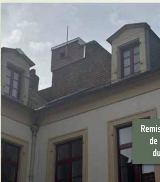
Remise en état de la tour du Guet