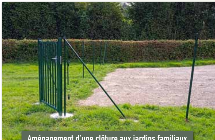
Aménagement d'une clôture aux jardins familiaux