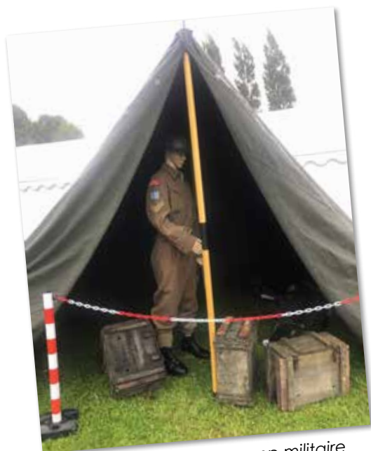
Reconstitution d'un camp militaire