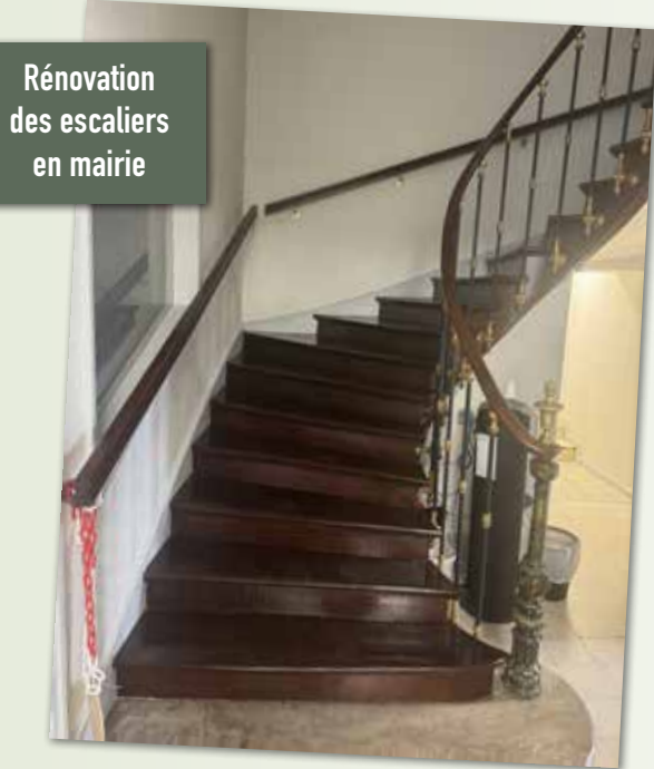
Rénovation des escaliers en mairie