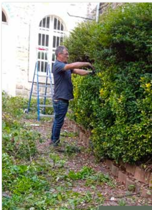
Entretien des espaces verts