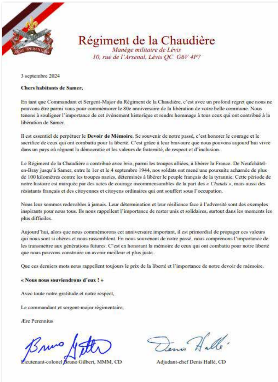
Lettre aux Samériens de la part du régiment de la Chaudière

Retrouvez l'événement sur : www.ville-samer.fr/80ans-liberation.html