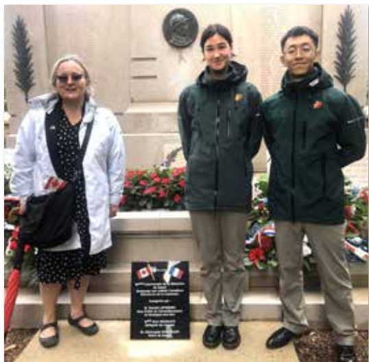
Les représentants du Canada