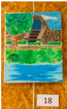
2 ème ado : Romain