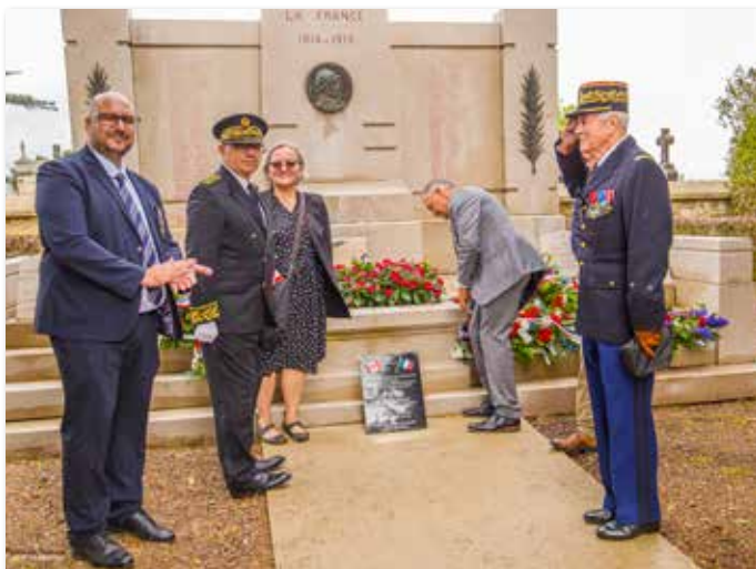
Une plaque commémorative a été apposée au monument aux morts