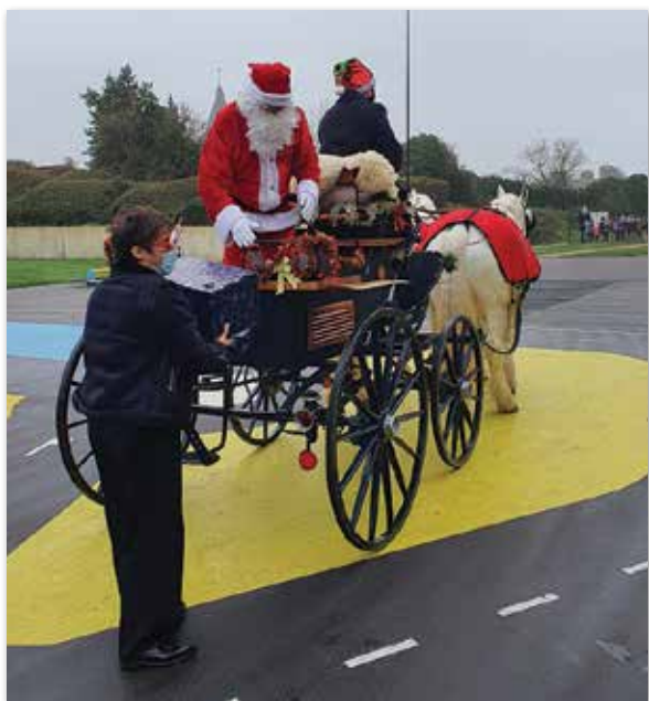
... à l'école Jean Moulin