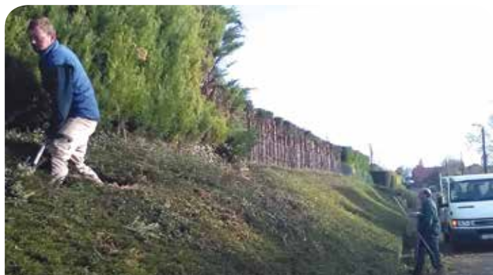
Entretien des espaces verts