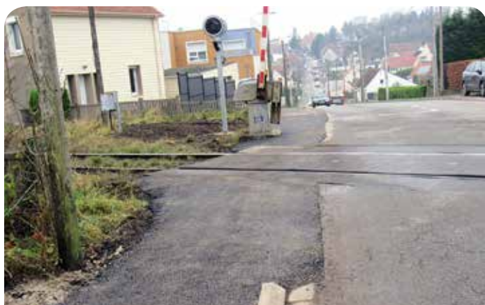
Passage piéton au niveau du passage à niveau, rue de Desvres