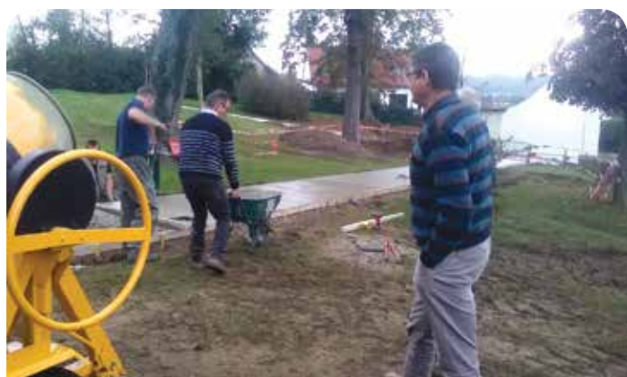
Finition de la liaison piétonne au jardin public