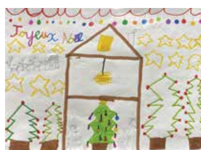
CE1 : Clémence Bonne