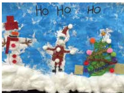
CP : Jade Leprêtre