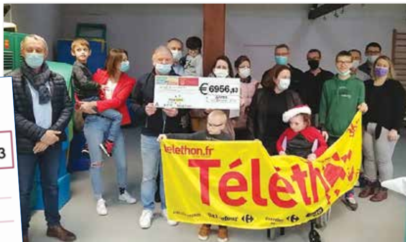
La remise du chèque à l'IME

Judi 16 décembre dernier, l'IME de Samer a accueilli une sympathique équipe destinée à remettre les fonds collectés lors du Téléthon à l'AFM.