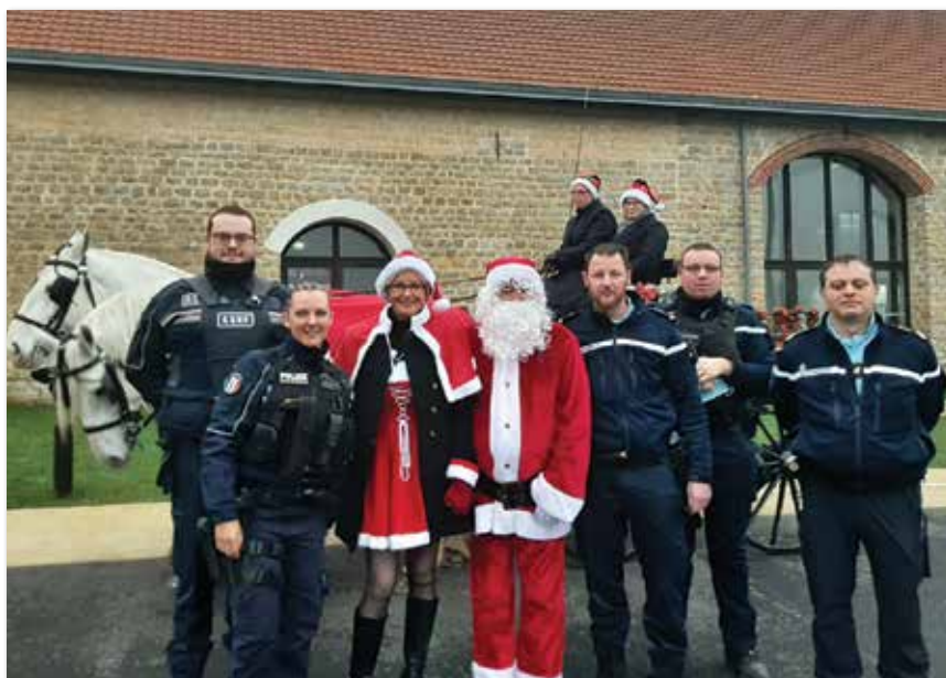
Le Père Noël accompagné de la Mère Noël