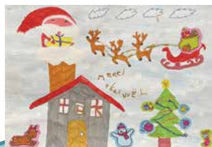
Grande section : Nathan Dumont