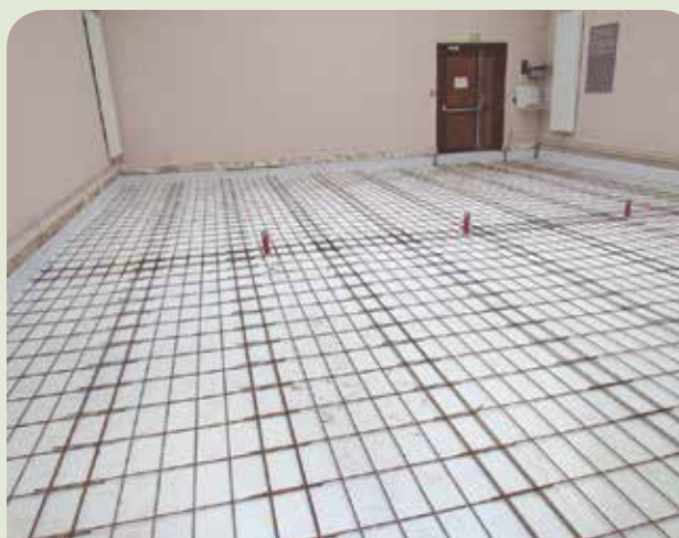
La dalle est prête à être coulée