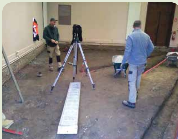
Commencement des travaux