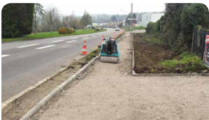
Liaison douce au niveau de la RD 901