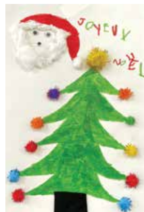
Moyenne section : Candice Poivre