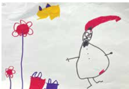
Toute petite section : Victoire Bouverne