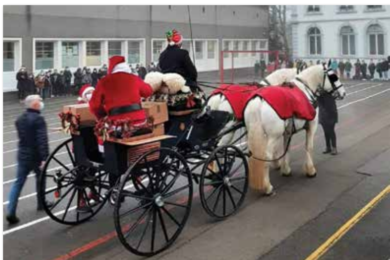
... à l'école Coustès

Source texte : VDB