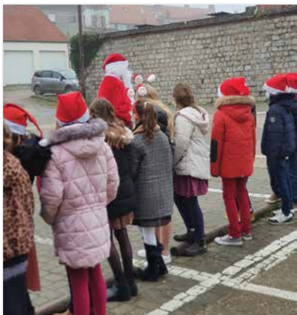
... à l'école Saint-Wulmer