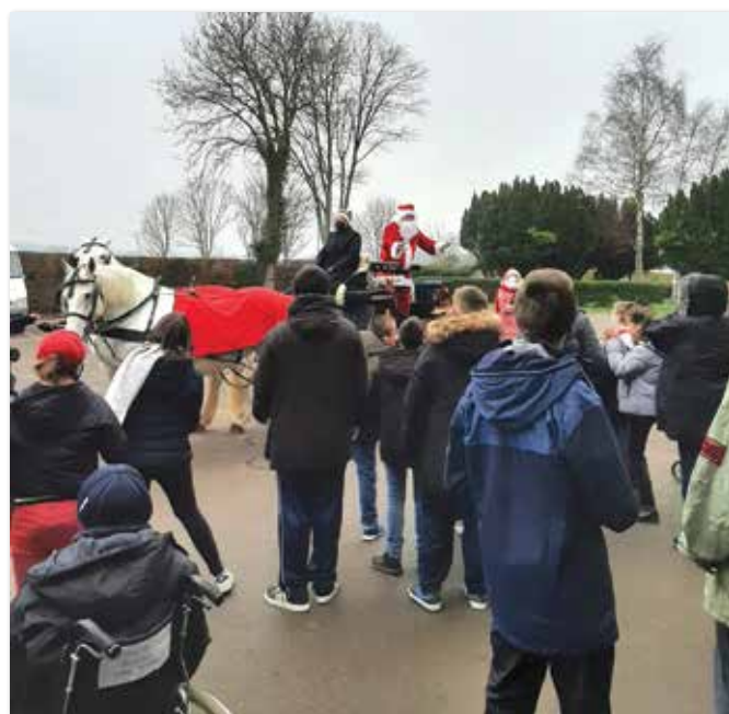
... à l'IME