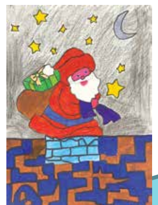
CM2 : Clément Froment