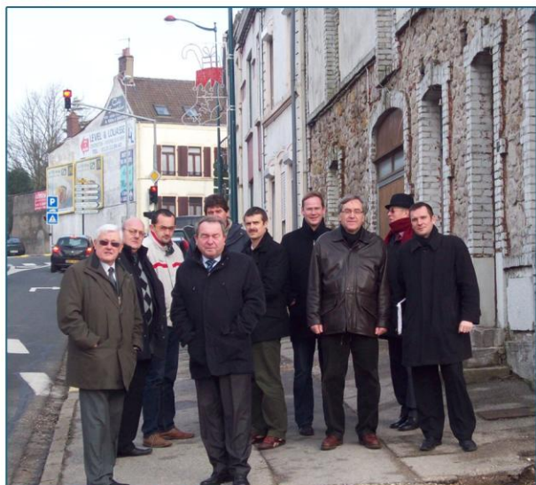
Lors de la réception des travaux

La prochaine tranche de travaux concernera le réaménagement de la voirie. L'avant-projet a été établi par la DDE, puis repris par V2R à Saint Martin. Il doit passer en 4 ème commission au Conseil Général.