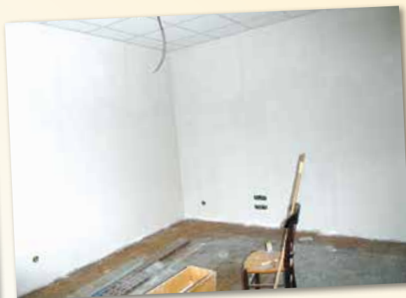
Aménagement de nouveaux bureaux à la mairie