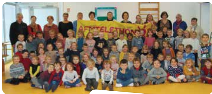
L'école Jean Moulin