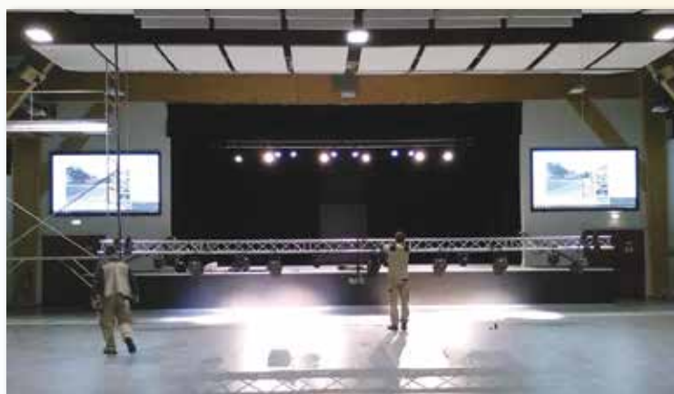
Installation d'un deuxième écran à la salle Polyvalente