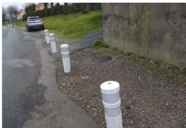
Pose des poteaux pour la sécurité des piétons Chemin de la gare