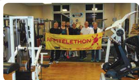
Le club de musculation