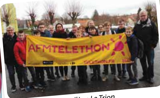
Le collège Le Trion