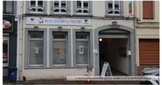
La Maison Intercommunale pour Tous: une structure pour faciliter les démarches des habitants.

La Communauté de Communes (CCDS) a ouvert des maisons des services à Desvres en 2011 et à Samer en 2017.