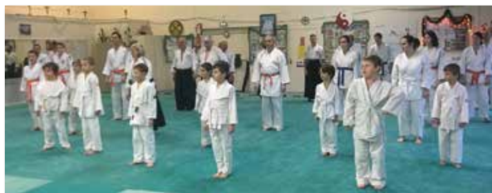
Ouverture de la cérémonie de vœux avec les associations de Samer, Le Portel, Rang du Fliers et Saint-Léonard.