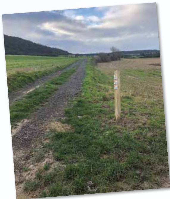
Chemin entre Longuérecques et la blanche jument