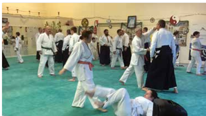
Démonstrations des différentes techniques par les enfants et les adultes.