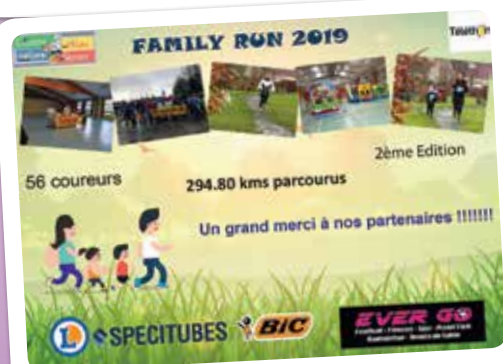
La Family Run