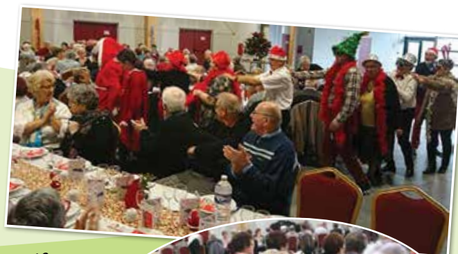
7 décembre 2019 : repas de Noël. Excellent repas, ambiance très chaleureuse et conviviale