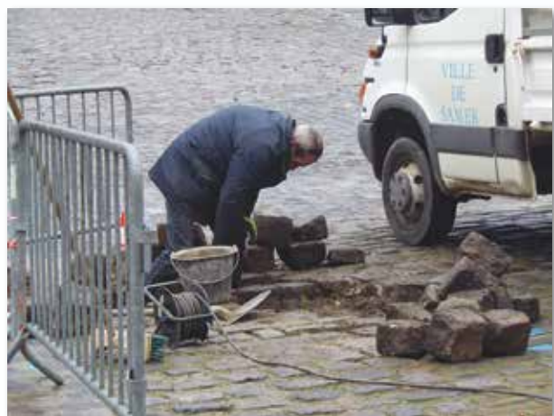
Notre employé communal continue de rénover les pavés de la Place Foch