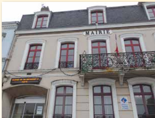
Installation de nouvelles fenêtres pour l'isolation de la mairie