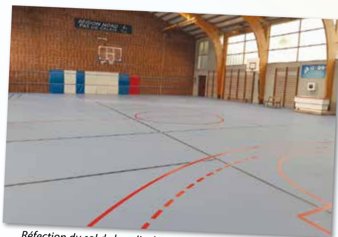
Réfection du sol de la salle des sports Le Trion pour 44 800 €