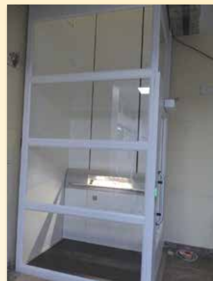
Installation d'un monte personne à la mairie

La majorité des travaux sont réalisés par nos employés communaux