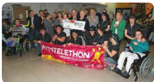
Remise du chèque Téléthon