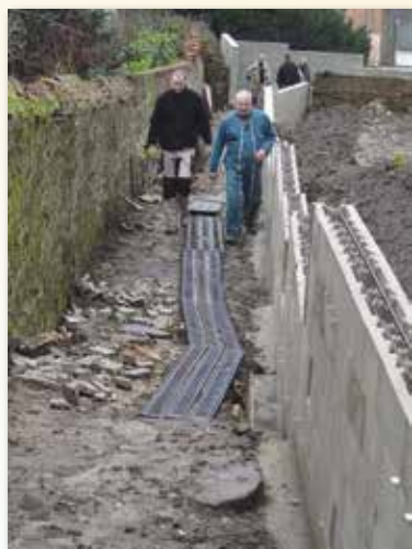
Création d'une liaison piétonne de la salle de restauration jusqu'à la place Foch