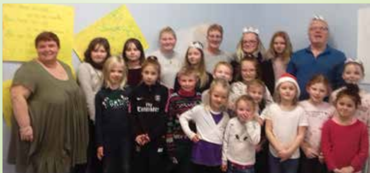
Source article : Dancing stars

Lors du marché de Noël, sur la place, les Dancing Stars vous ont proposé un petit spectacle de danse avant l'arrivée du père Noël ! Toute l'équipe des Dancing Stars vous souhaite une bonne et heureuse année 2020.