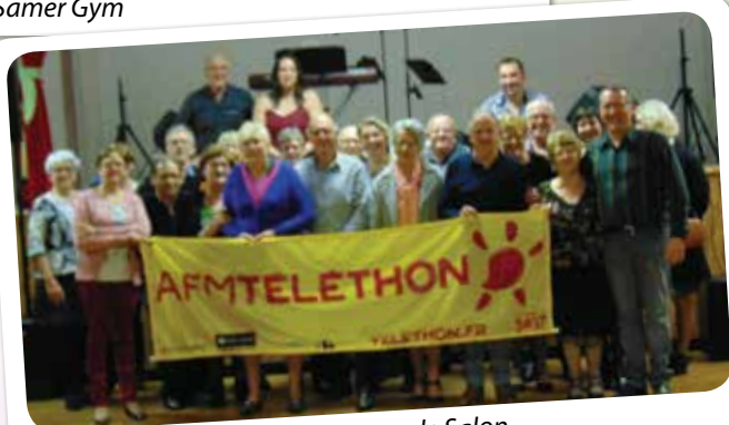
Samer Danse de Salon