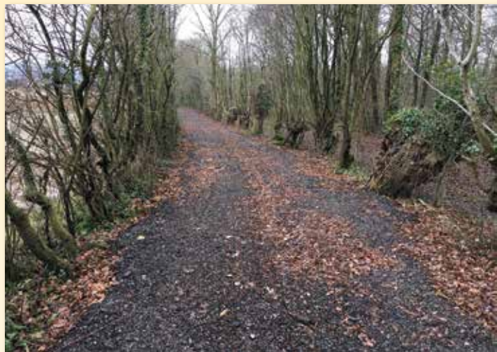
Chemin de Cappe

Remise en état et remblaiement des Chemins de randonnée VTT, pédestre et hippique