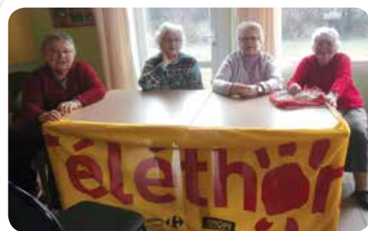
Tout au féminin