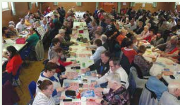
2 ème Loto quine de l'année le 20 octobre 2019. Belle réussite, salle comble, de nombreux lots ont ravi les participants.