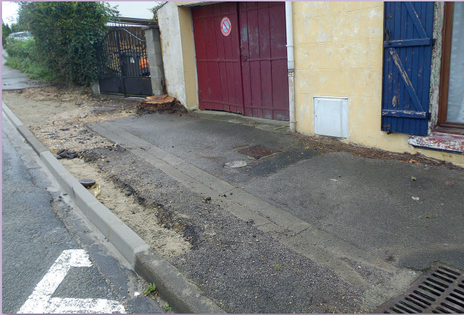
Pose de berceau aux riverains pour leur permettre d'accéder à leur garage rue de Questrecques