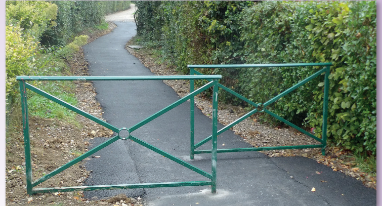
Remise en état du chemin piétonnier entre la rue de Neufchâtel et la rue Roger Salengro.