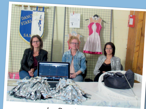
Les Dancing Stars