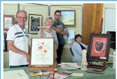
Samer Loisirs pour Tous Section Peinture