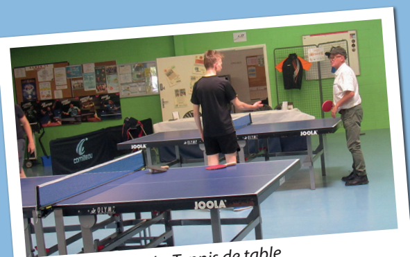
Le Tennis de table