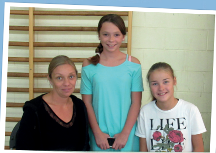
La Danse un Langage