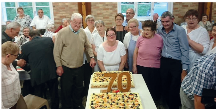
Le 7 octobre dernier, ce fut le 70 ème repas offert aux aînés de Samer