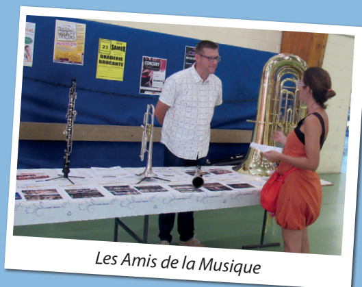
Les Amis de la Musique