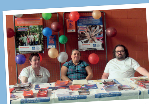
Le Secours Catholique