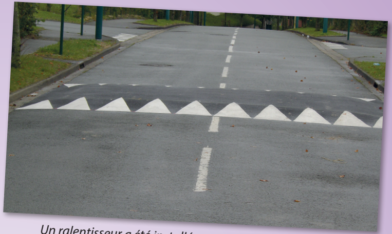
Un ralentisseur a été installé rue Nicolas Jacques Conté.