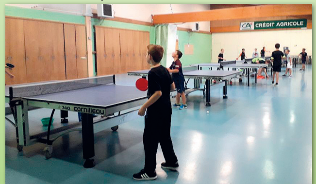
Entraînement des jeunes

sents et le Samer TT y sera représenté par deux Arbitres du club. Nos deux Juges-Arbitres dirigent régulièrement des rencontres Nationales et régionales avec l'aide de nos Arbitres. N'oublions pas notre président d'honneur qui fera parti du staff lors de la coupe du monde à Paris ce mois d'octobre. Gageons que ce climat idyllique perdure et que ce club récolte la moisson de réussites espérées, les efforts de chacun devraient être récompensés, persévérons, nous suivons le bon chemin.