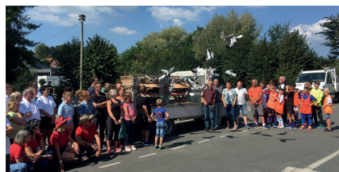
Le lâcher de pigeons