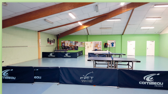
Stand SAMER Tennis de Table : Journée des Associations

Le Samer Tennis de Table commence à être connu et reconnu dans le milieu pongiste et dans les instances dirigeantes, autant au niveau départemental que régional, notre salle B. Lemanski est également retenue pour organiser des compétitions de tous niveaux, de part la grandeur et la qualité de celle-ci que par l'excellence de l'organisation, la disponibilité des membres