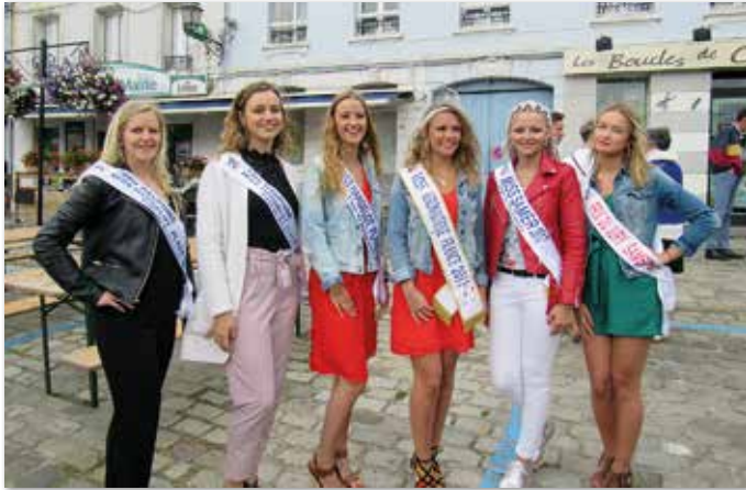
Les Miss Samer

Au programme, concours de pétanque, course pédestre, exposition, marché de terroir, brocante, méchoui et concours de fraises.