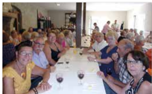
Visite d'une fromagerie et dégustation à la ferme de Moernaar Middenweg à FURNES

Après un voyage en Corse fin mai réussi, nos Aînés sont heureux de se retrouver le jeudi 5 juillet 2018 pour un déplacement vers la Belgique.