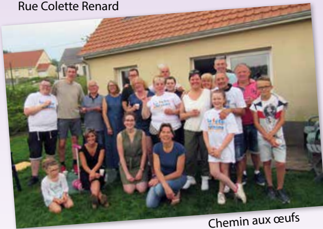
Chemin aux œufs