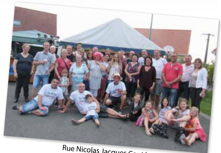
Rue Nicolas Jacques Conté