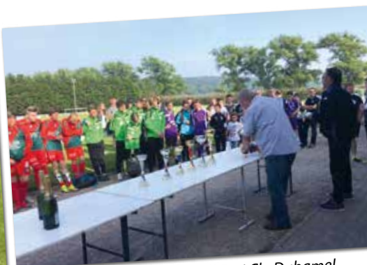
U 15 - Vainqueurs du tournoi Ch. Duhamel