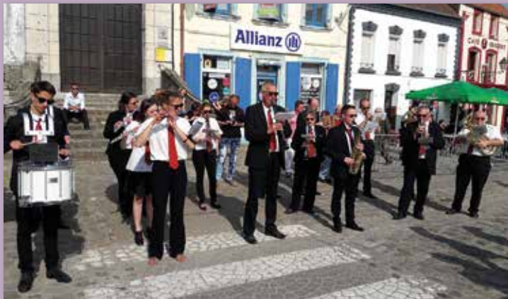
Concert de l'Harmonie Municipale