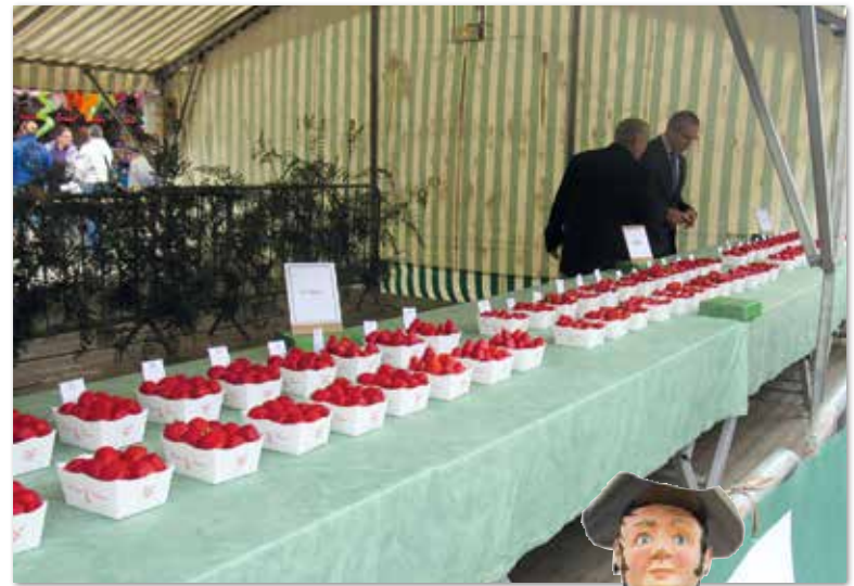
Le concours de fraises