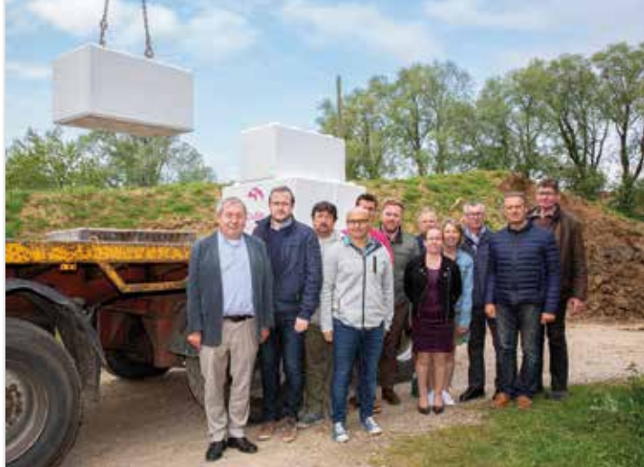
Livraison des Cubes le 15 mai 2018