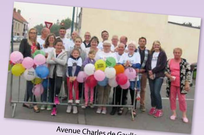
Avenue Charles de Gaulle