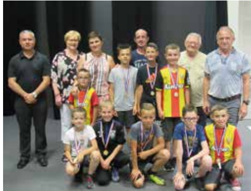
FOOTBALL - Les U11