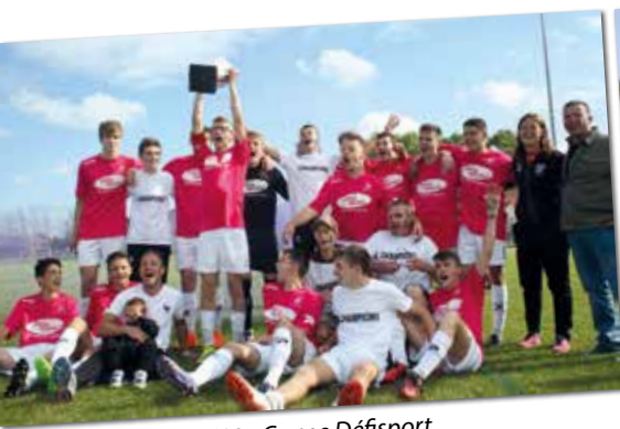
U18 - Coupe Défisport

Un grand bravo pour ces belles performances.