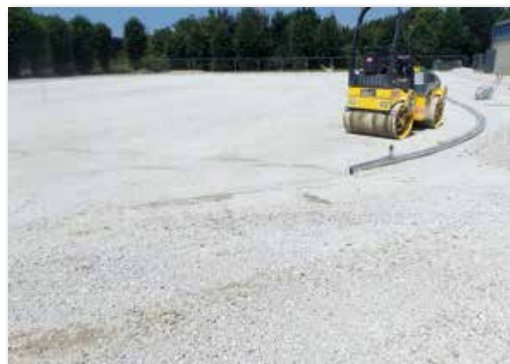
Avancement des travaux du terrain Multisports à la Salle Lemanski