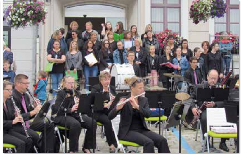
Concert de l'Harmonie Municipale et de la chorale "Sam'Chante"