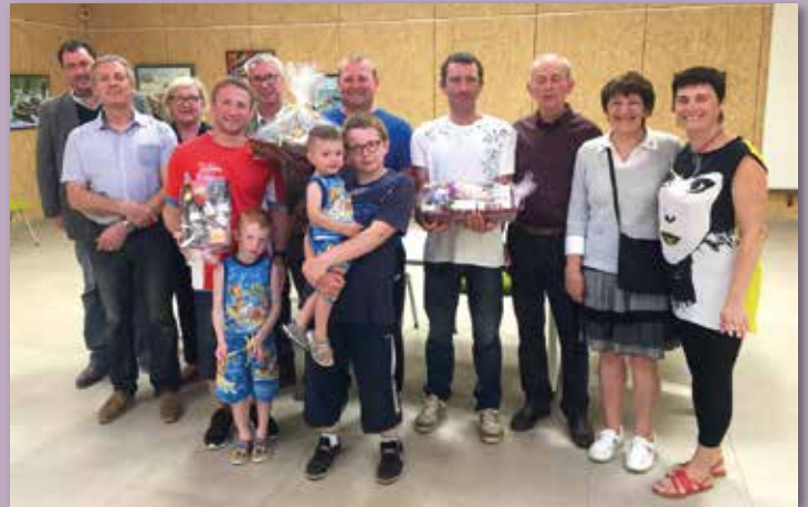
Remise des prix du concours de lâcher de pigeons