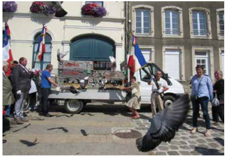
Le lâcher de pigeons par l'éclaireur Samérien