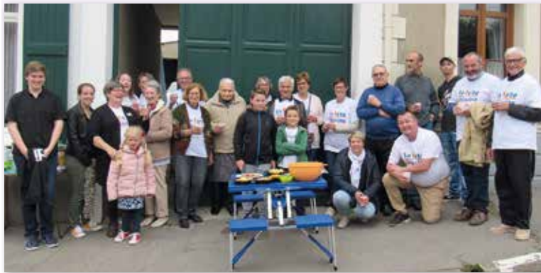
Rue du Breuil