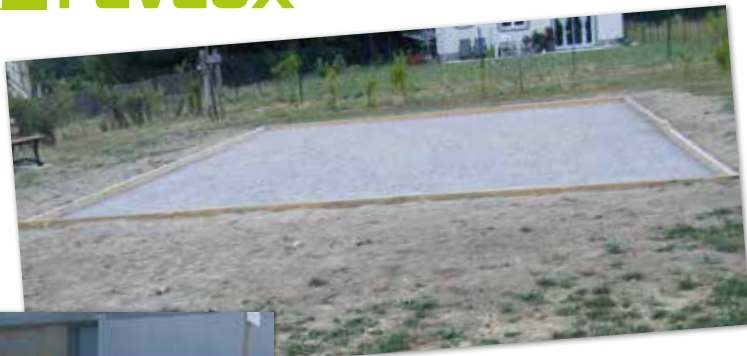
Réalisation d'un terrain de pétanque, résidence Eugène Chigot