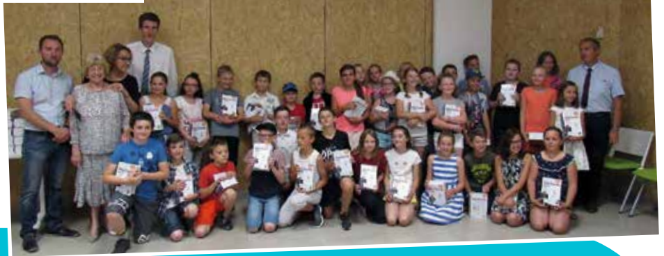
Remise des dictionnaires aux enfants de Samer admis en classe de 6 ème