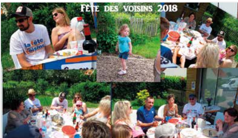
Rue Léo Ferré