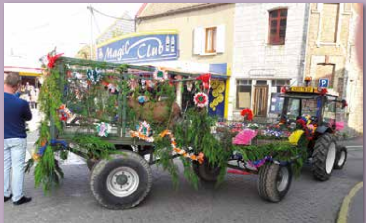
Parade de la biche