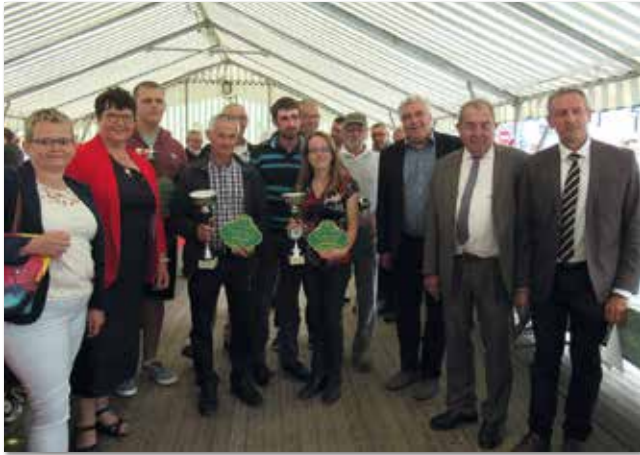
Remise des prix de la fête des fraises