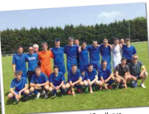
U18 - Champions d'Excellence