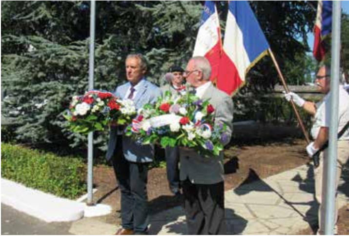
Commémoration de la fête nationale au monument aux morts