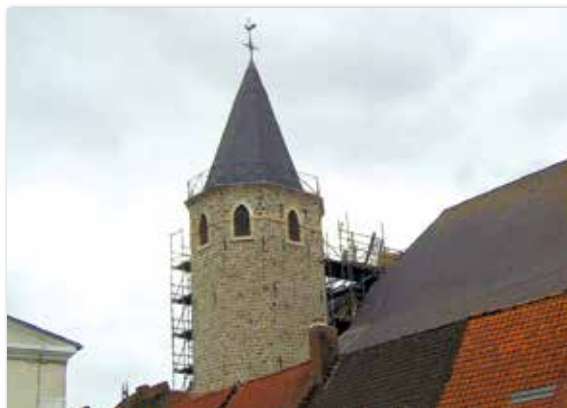
Fin des réparations du clocher avec le démontage de l'échaffaudage