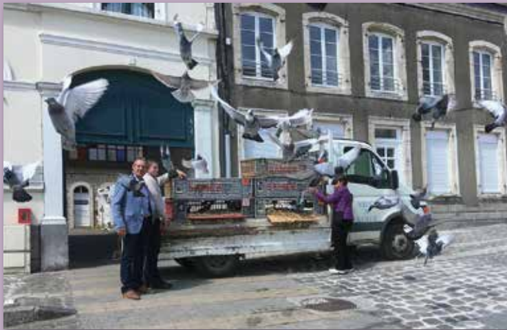
Le lâcher de pigeons

La ducasse, c'est notre fête communale ! Elle s'est déroulée sur la place du Maréchal Foch du 19 au 22 Mai 2018. Comme chaque année, ce sont 4 jours de réjouissance que la municipalité propose à la population.