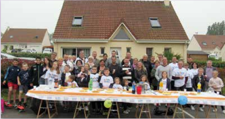
Rue Colette Renard

Dans différents quartiers la fête des voisins a été l'occasion de bons moments de convivialité et de partage. D'année en année celle-ci s'étoffe, permettant des échanges sympathiques et de belles découvertes.