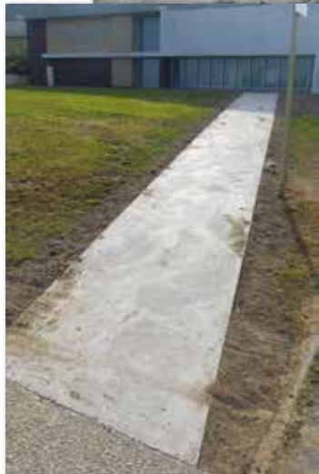
Création d'un passage piétons pour accéder aux plus près de la garderie Ecole Jean Moulin