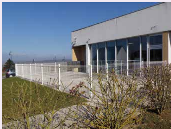
Fermeture de la terrasse de l'école maternelle Jean Moulin pour l'accès aux petits