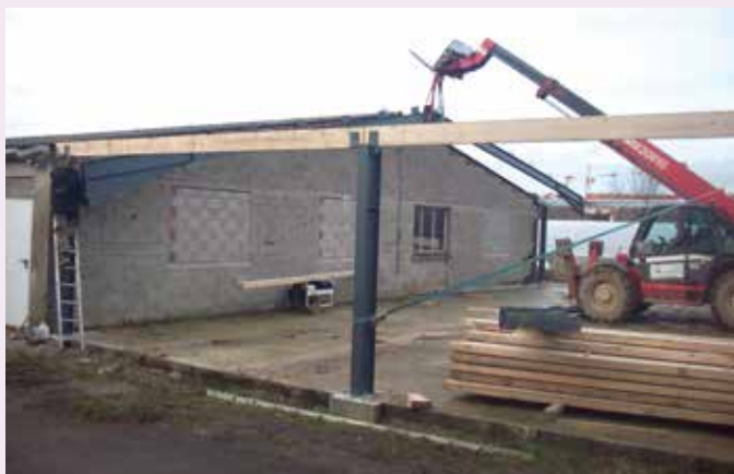
Extension des ateliers municipaux