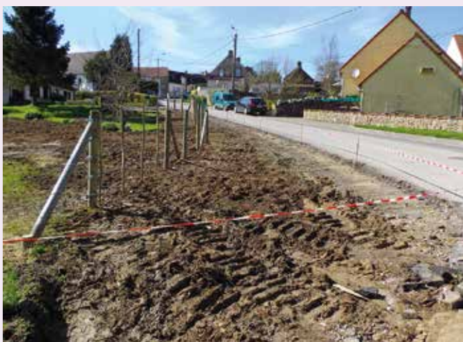
Réalisation de trottoir rue de Longuerecques en venant de la rue de la Basse-Cour