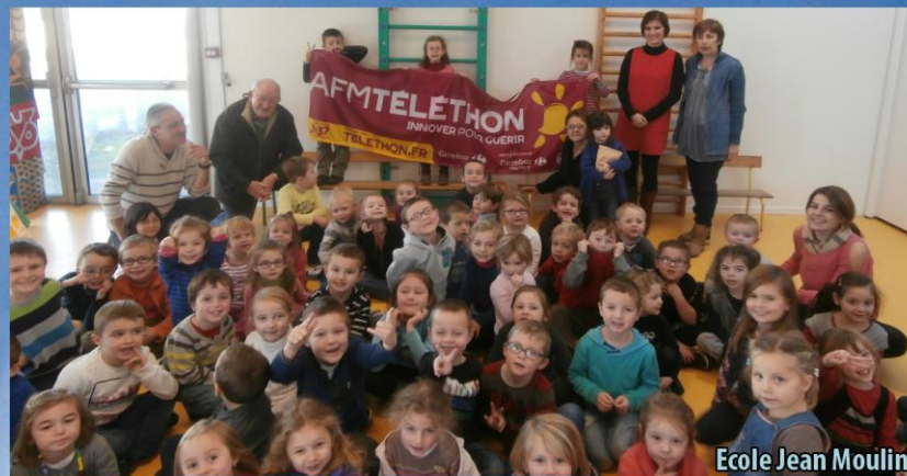
Ecole Jean Moulin