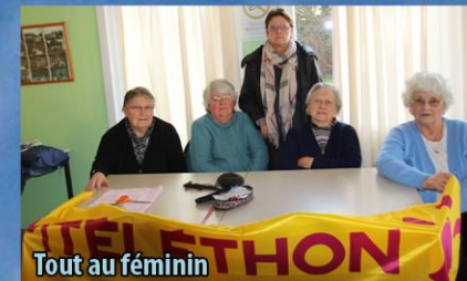
Tout au féminin