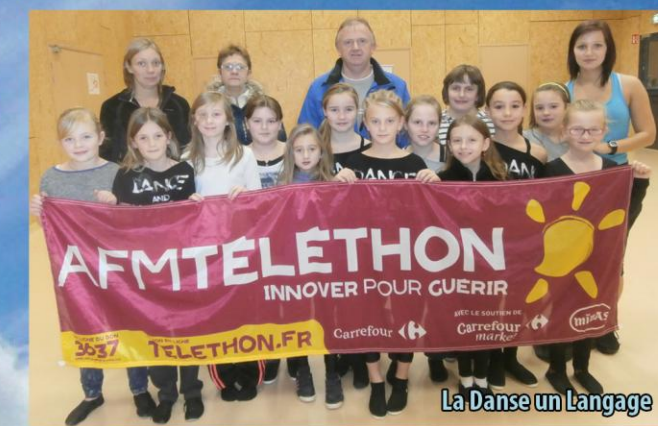
La Danse un Langage