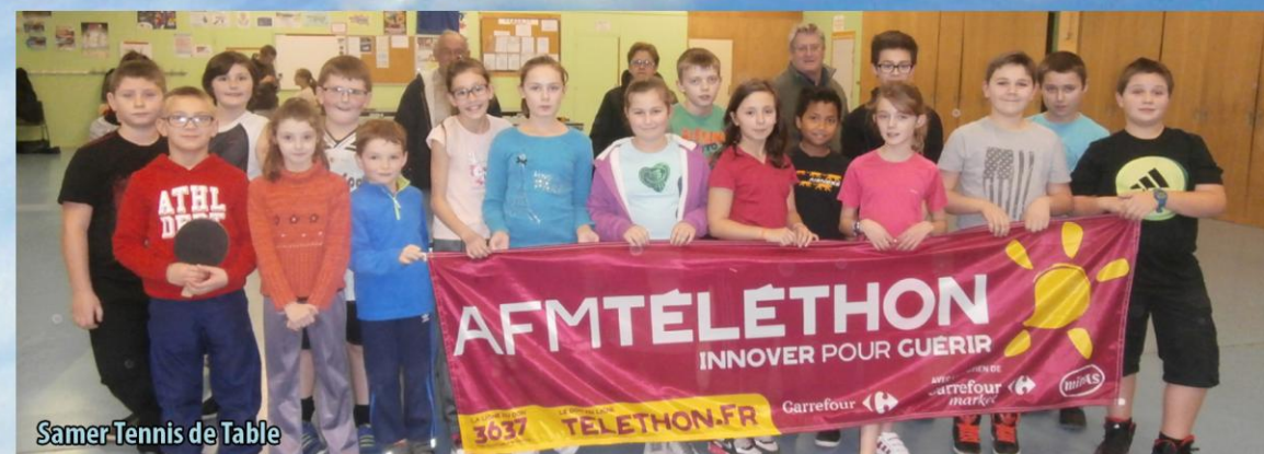
Samer Tennis de Table