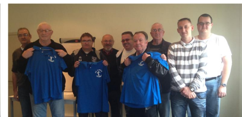
Le nouveau bureau de l'association