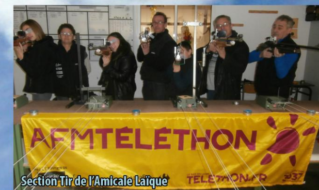
Section Tir de l'Amicale Laïque