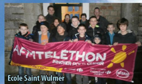
Ecole Saint Wulmer