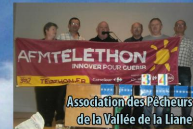
Association des Pêcheurs de la Vallée de la Liane