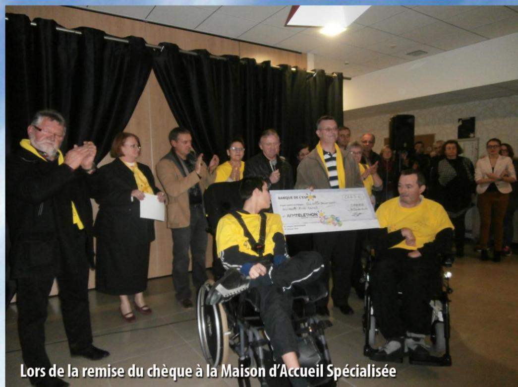
Lors de la remise du chèque à la Maison d'Accueil Spécialisée