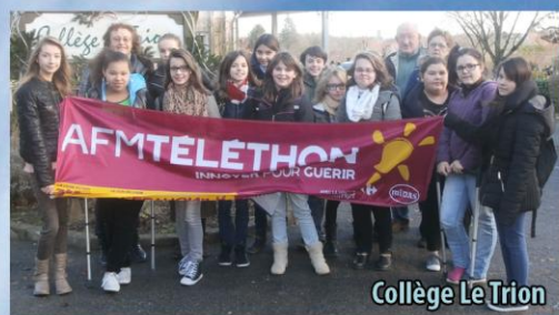
Collège Le Trion