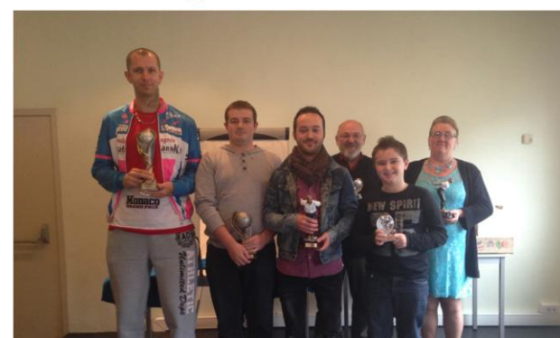
Les lauréats du concours