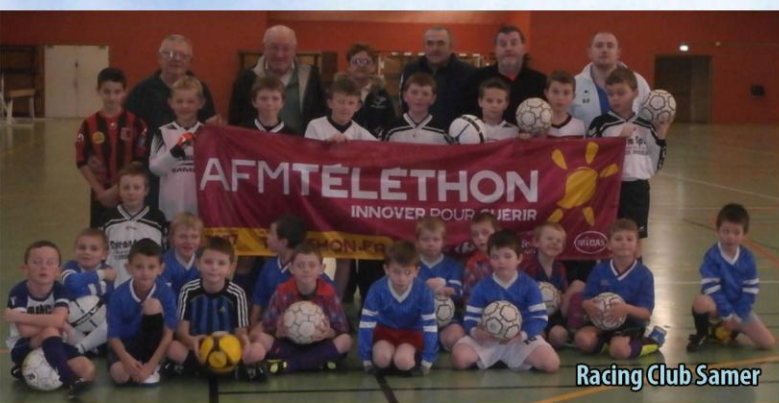
Racing Club Samer