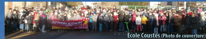
Ecole Coustès (Photo de couverture)