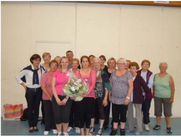
Photo de clôture de la saison 2012, preuve (s'il en fallait une !) que notre groupe fonctionne dans la joie et la bonne humeur !

Les cours reprendront dans la même ambiance à compter du mercredi 12 septembre, de 19 h à 20 h, à la salle Lemanski : venez donc nous rejoindre !